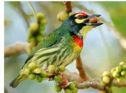
Coppersmith Barbet on Ficus religiosa