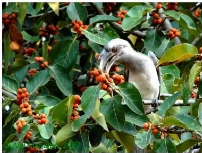
Indian Grey Hornbill